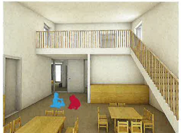
Neubau Kita Cassano