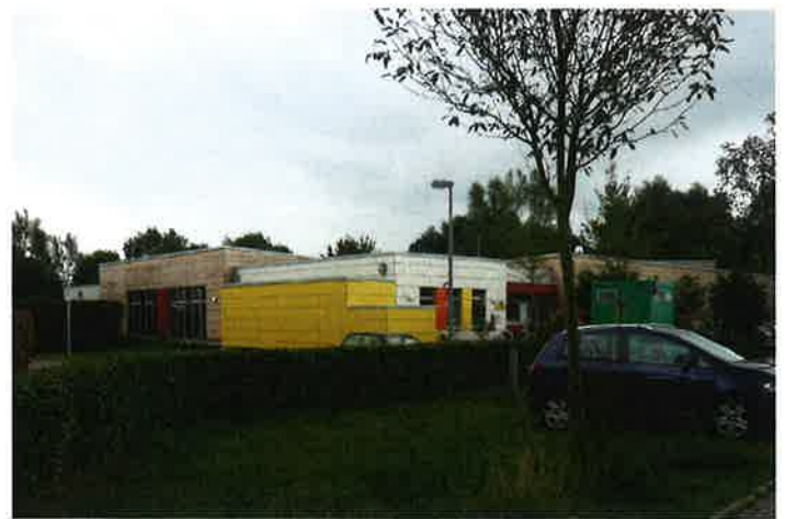
kbg Neubau KiTa Eisfloth Referenzen Fassade