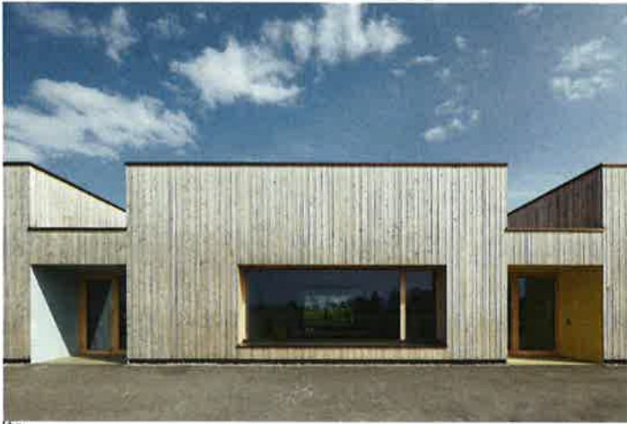
kbg Neubau KiTa Eisfloth Referenzen Fassade