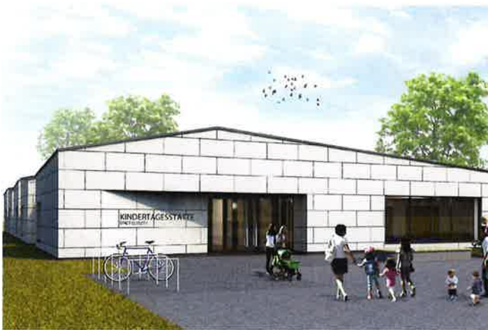
kbg Neubau KiTa Eisfloth Playstage