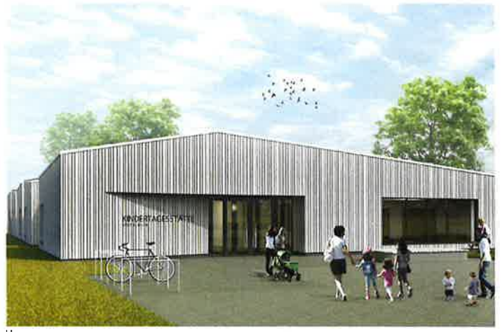
kbg Neubau KiTa Eisfloth Playstage