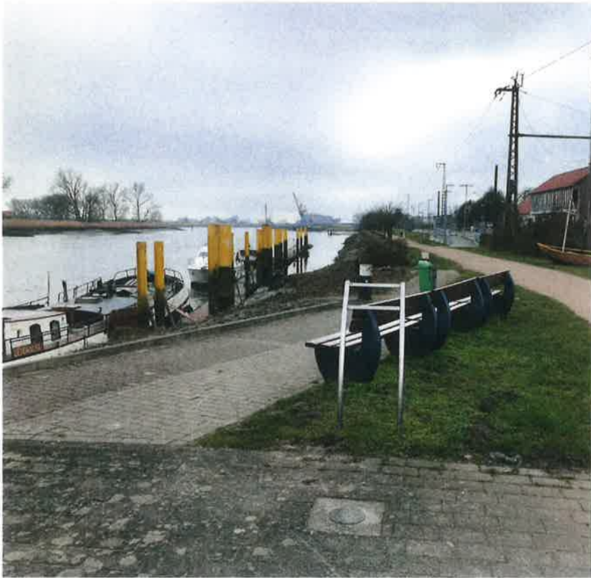
(POI Promenadenweg, An der Kaje)