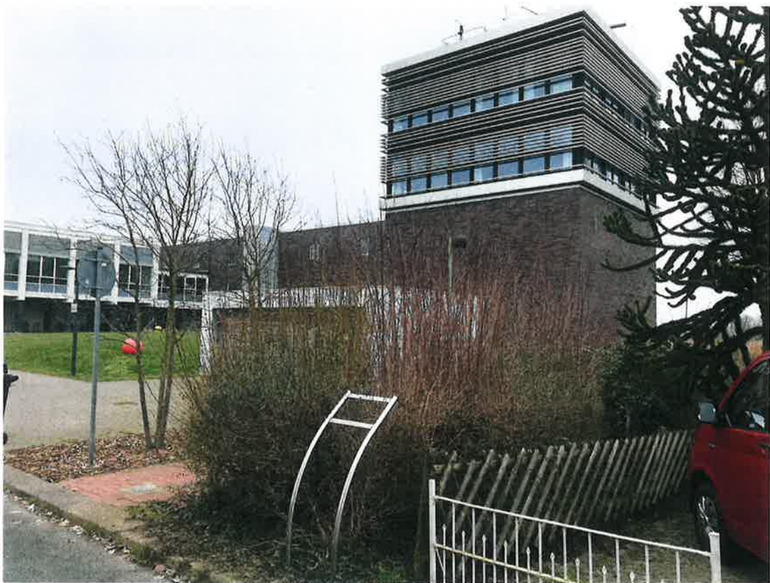
(POI Seefahrtsschule, Weserstraße)

Zusätzlich zeigte Frau Gehlhaar, wie die Schildhalterungen der maritimen Wege aussehen, die zukünftig für den Hörrundgang genutzt werden sollen.